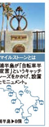
マイルストーンとは 三浦半島が「自転車半島宣言」というキャッチフレーズを掲げ、設置したモニュメント。 三浦半島 8箇所

マイルストーン(記念撮影用モニュメント)は、各設置場所の地域特性を活かしデザインされたブロンズ像が白御影石の台座に設置されたもので、三浦半島に全8カ所設置されています。マイルストーンに隣接してサイクルステーションが設置され、バイクラックや展望デッキ、あずまやなどが整備された休憩施設としても利用できます。